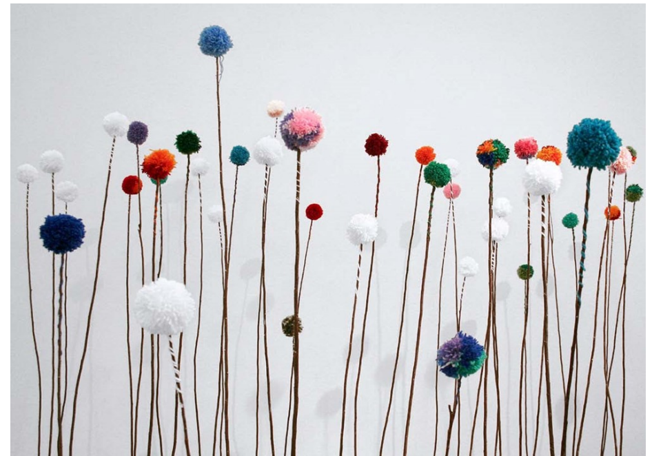
Opera di Serena Piccinini . Le Jardin