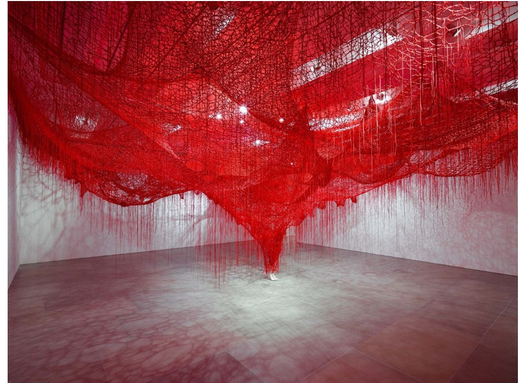
Chiharu Shiota, Me Somewhere Else (2018) presso la galleria Blain|Southern London, foto di Peter Mallet